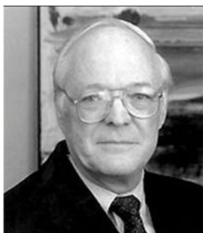
จอห์น เนฟฟ์ (John Neff)

“หุ้นที่มีอัตราการเติบโตที่ไม่หรือหยา และมี P/E ที่ต่ำ นอกจากจะมีความเสี่ยงต่ำแล้ว นักลงทุนยังมีโอกาสได้ประหลาดใจ เมื่อเห็นผลของการขยายตัวของ P/E ได้ยิ่งกว่าหุ้นที่มีอัตราการเติบโตหรือหยาเสียอีก”